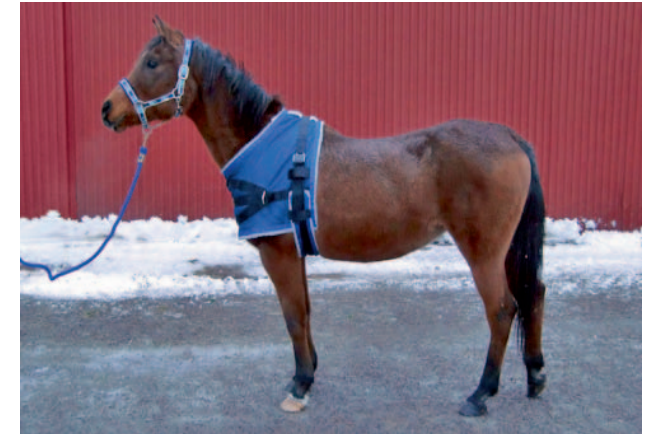
Das Geschirr fängt die Masse des Pferdes beim Bremsen großflächig auf und lässt sich bequem tragen.

Die Gurte werden an beiden Seiten des Transporters befestigt. Zusätzlich wird der Gurt im vorderen Teil des Transporters durch eine massive Öse geführt, die das Steigen und das Hinlegen des Pferdes verhindert. Trotz des Arvak Belts hat das Pferd noch genügend Bewegungsfreiheit.